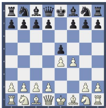
RONDA 1 GAMBITO DE REY

En las tres primeras rondas, la apertura será obligada, rememorando las aperturas y defensas que tanto le gustó jugar a Augusto Menvielle Laccourreye. Los siguientes diagramas muestran las posiciones iniciales y el turno de juego: